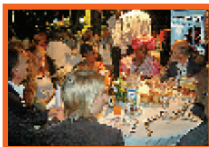
OPPORTUNITÉS DE SPONSORINGS A FORT IMPACT