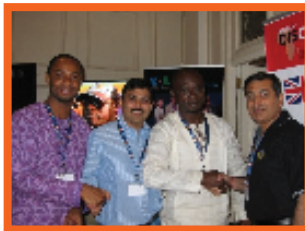
LES RENDEZ-VOUS SONT PRÉPARÉS EN AVANCE PAR NOTRE ÉQUIPE DÉDIÉE