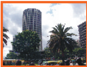
DISCOP EVENTS ONT LIEU DANS DES HOTELS CINQ ETOILES

Lancé en 2009, DISCOP AFRICA est un salon de distribution de programmes et de coproduction, qui cible les opérateurs de télévision payante et publique de 47 pays d'Afrique subsaharienne.