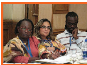
SESSIONS DE FORMATION ET DE PITCHING PORTÉES SUR DES OCCASIONS INTRA- RÉGIONALES DE COPRODUCTION