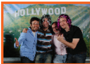
LES EVENEMENTS DISCOP SONT RENOMMÉS POUR LEUR POUVOIR DE RÉSEAUTAGE